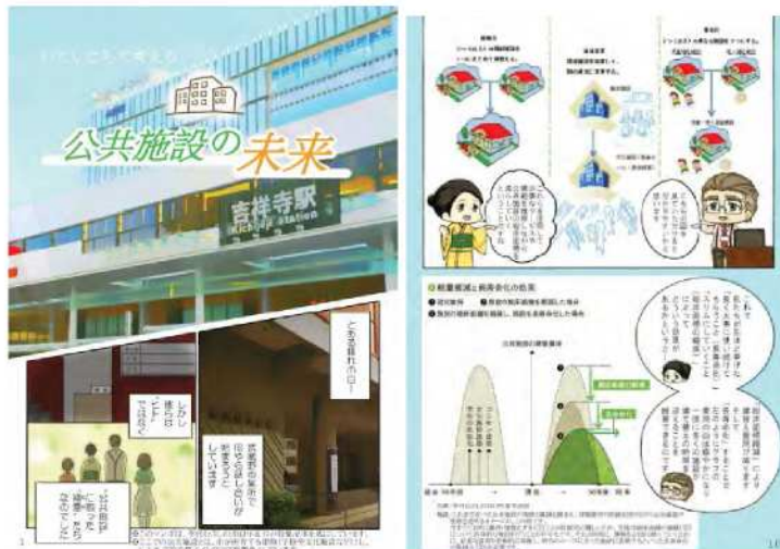
※東京都武蔵野市が学生とともに制作