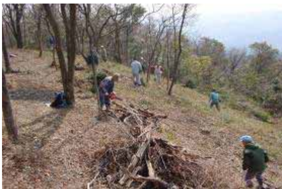
<作業する会員のみなさん>

作業は毎回15人程度が集まり、作業の全体像を伝えた後は各自が持ち場を思い思いにやっています。ここまで必ずやる、ではなく、できるところまでを楽しみながらやっているの、無理がありません。