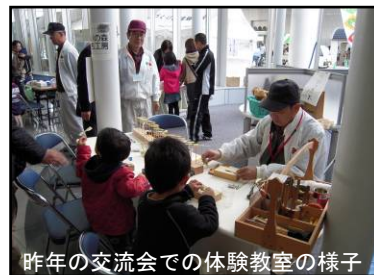
昨年の交流会での体験教室の様子