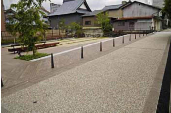
車道舗装の例、洗出しコンクリート舗装（地場骨材）（勝山市、福井）