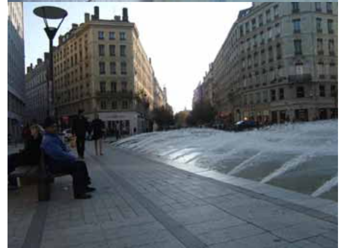
B案小広場水景イメージ（レハブリック広場、リヨン）