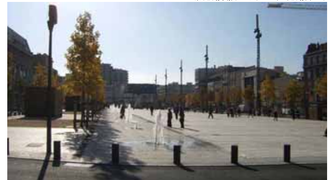
水景イメージ（クレルモン・フェラン）