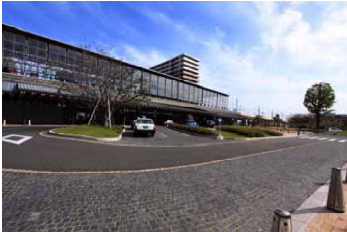
車道舗装の例、道路部：黒アスファルト舗装、停車部：小舗石（黒御影石）舗装（日向市駅、日向市、宮崎）