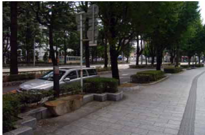
周南市内の自然石による歩道舗装（御幸通り）