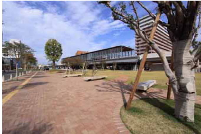
歩道舗装の例、煉瓦舗装（日向市駅、日向市、宮崎）