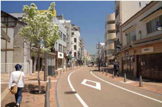
車道・歩道舗装の例、車道舗装：脱色アスファルト舗装、歩道舗装：煉瓦舗装（ローフウェイ街、松山市、愛媛）