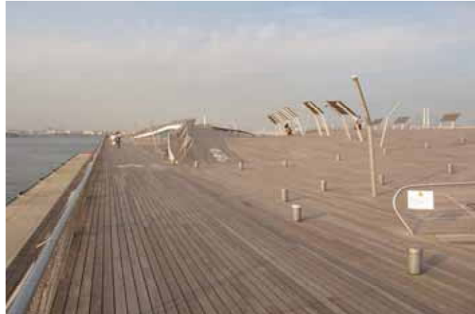
イベ材によるボードデッキの例（大棧橋フェリーターミナル、横浜）