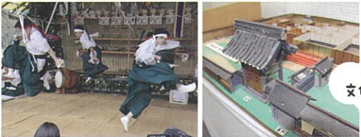
三作神楽(国指定文化財) 福川本陣跡(市指定文化財)模型