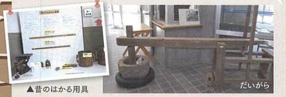
▲昔のはかる用具 だいから