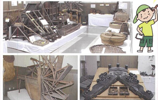
足踏み水車 富田瓦