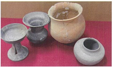
永源山横穴墓出土遺物(市指定文化財) 竹島古墳出土品(国指定文化財、展示品はレプリカ)

竹島古墳出土品(レプリカ)や永源山横穴墓出土遺物、若山城跡・福川本陣跡、伝統芸能など市内の歴史・文化財について紹介しています。