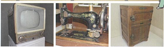
ブラウン管テレビ 手回しミシン 氷冷蔵庫