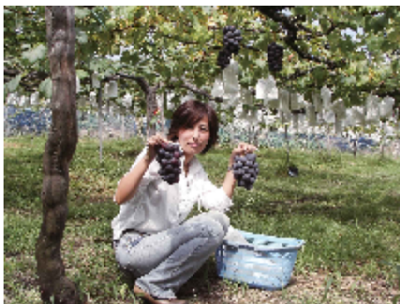
上・須方市の景観 下・須金フルーツランド