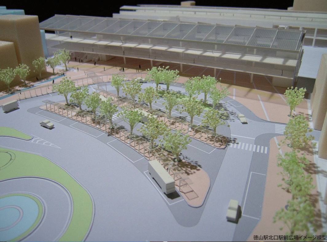
徳山駅北口駅前広場イメージ模型