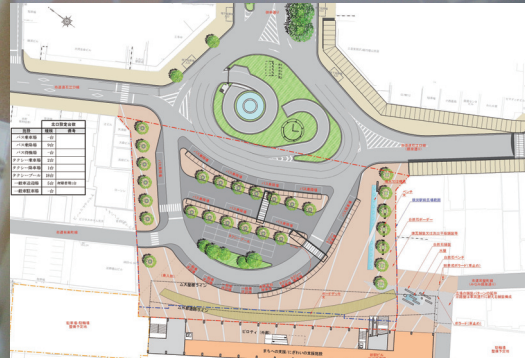
徳山駅北口駅前広場基本計画案