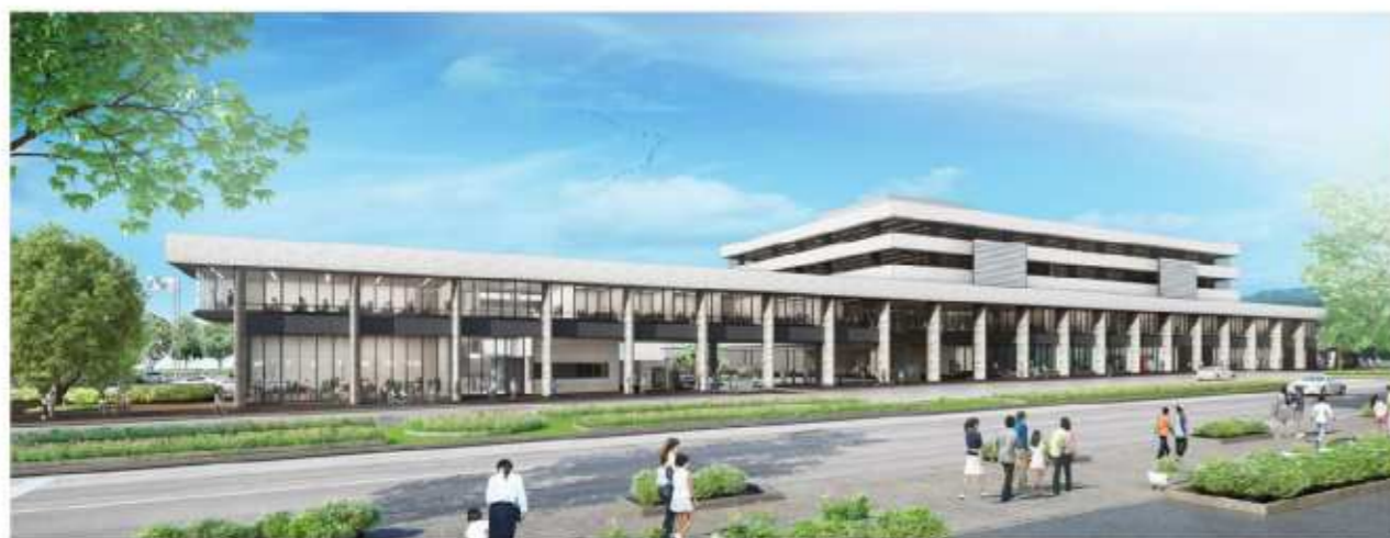
新庁舎のイメージ