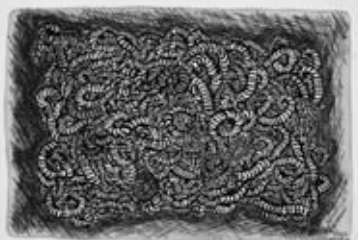
「虫」 水彩、油彩ペン 1961(昭和36)年8月

タイトルは「虫」ですが、どこが頭で、どこが終わりなのか分かりません。それとも、まったく別のものなのでしょうか。多くの方は、この絵を見て何か不安を感じるよう