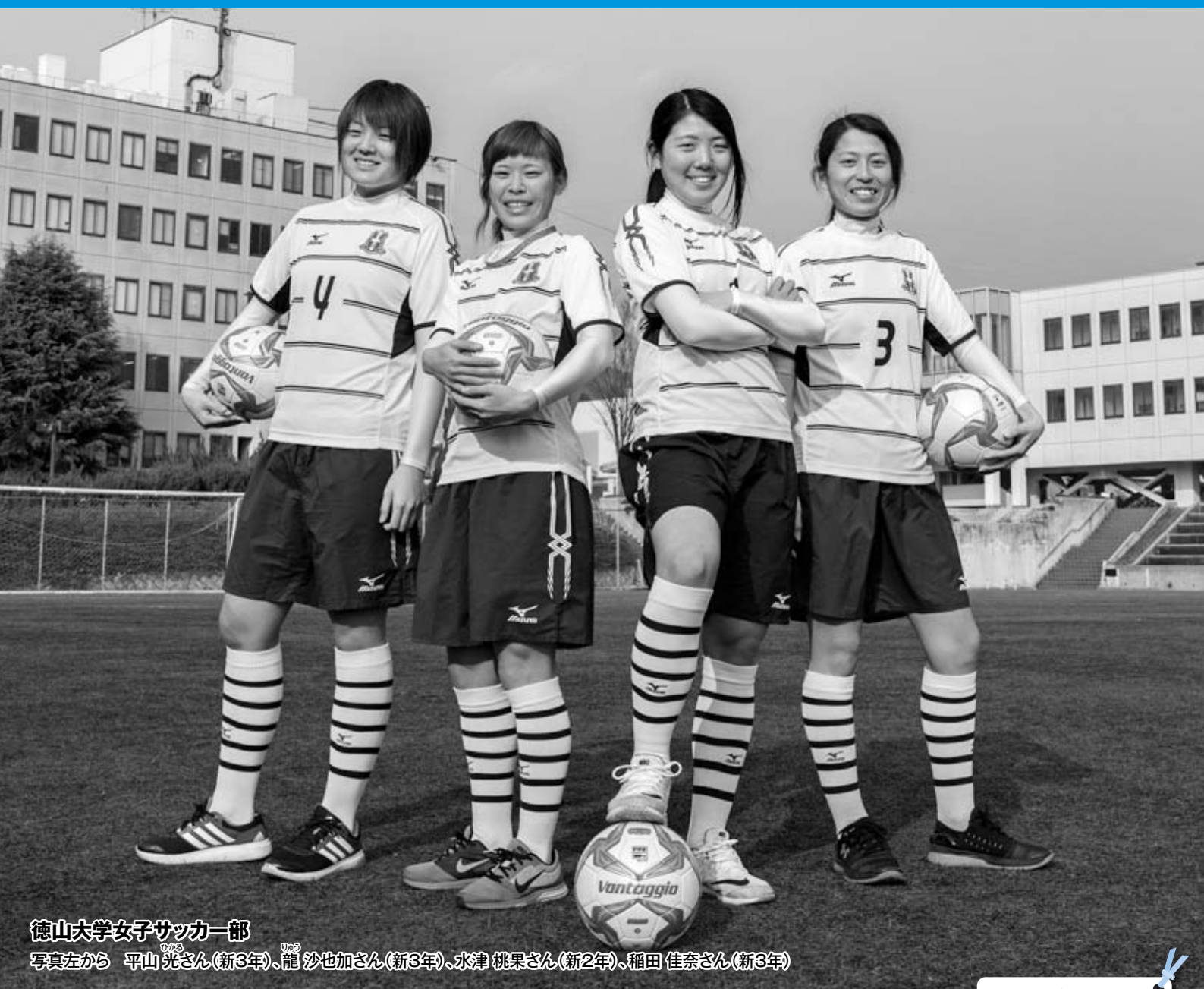
徳山大学女子サッカー部