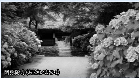
阿弥陀寺(あじさいまつり)