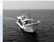
▲周南のハモは関西地方でも高い評価を得ています