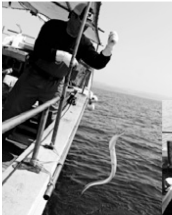
▲ハモを釣り上げる様子