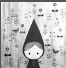
赤ずきん 花が咲いたよ(2011)

●期間／7月30日(日)まで ▼観覧料／一般900(750)円、大学生700(550)円 ※ ( ) 内は前売りおよび20人以上の団体 ※本展を鑑賞の際は、常設展も無料で観覧できます。