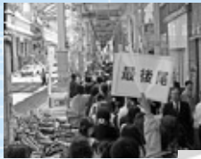
多くの人でにぎわう前回の様子

マも毎回工夫していきます。実行委員会の皆さんは、駅周辺の工事がどんどん進んでいて、まちの変化を感じています。商店街に行きたくなくなるイベントをこれからも実施していきたいと感じています。