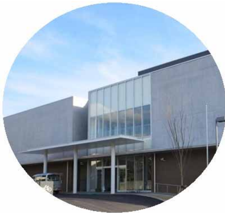
周南市学び・交流プラザ（H27.4.13オープン）