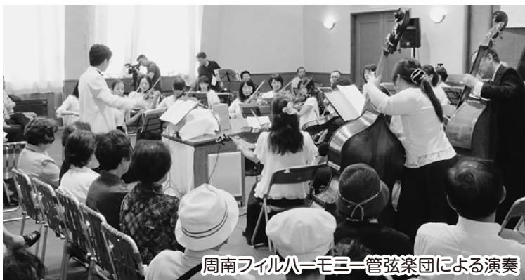
周南フィルハーモニー管弦楽団による演奏