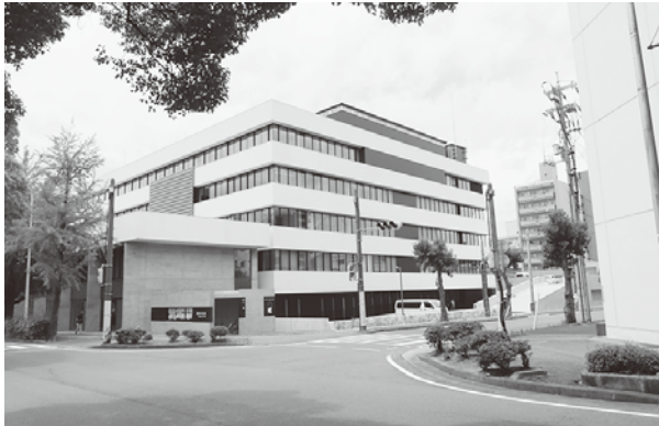
新庁舎外観 (北側から撮影)