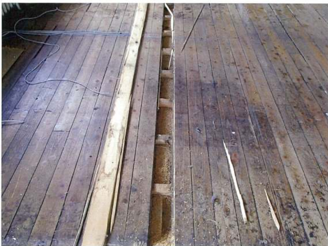
本館 3階 財政課 床下粗殻 (先行解体部分)