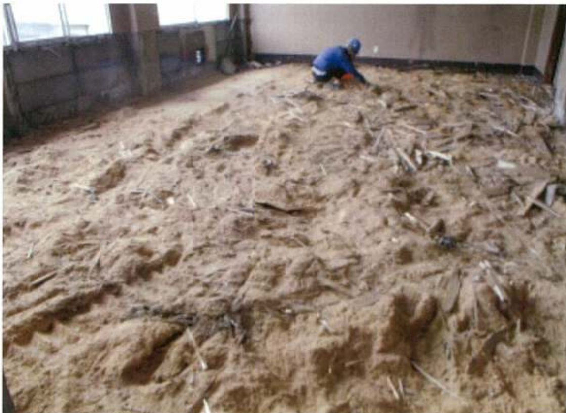
本館2階 第二応接室 床下撤去後粗穀確認 (先行解体部分)