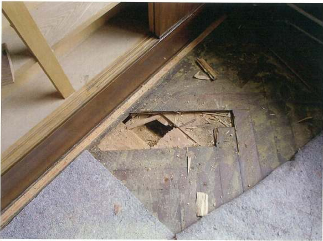
西本館 2階 正副議長室 床カーペット+フローリング+フローリング 床下柵殻