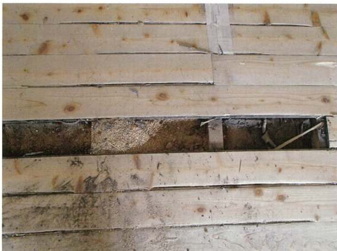
本館 2階 企画課 床下粗殻 (先行解体部分)