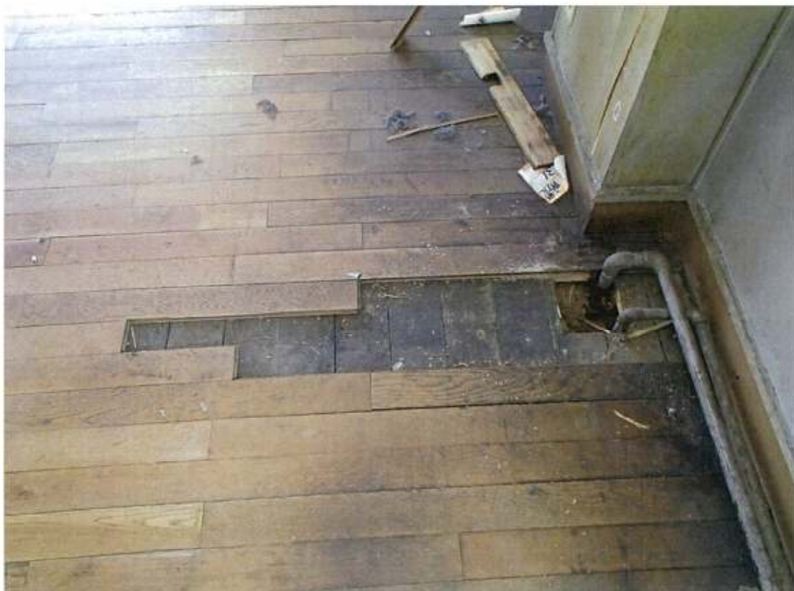
本館3階 防災会議室 床フローリング+フローリング 床下靱殻 (先行解体部分)