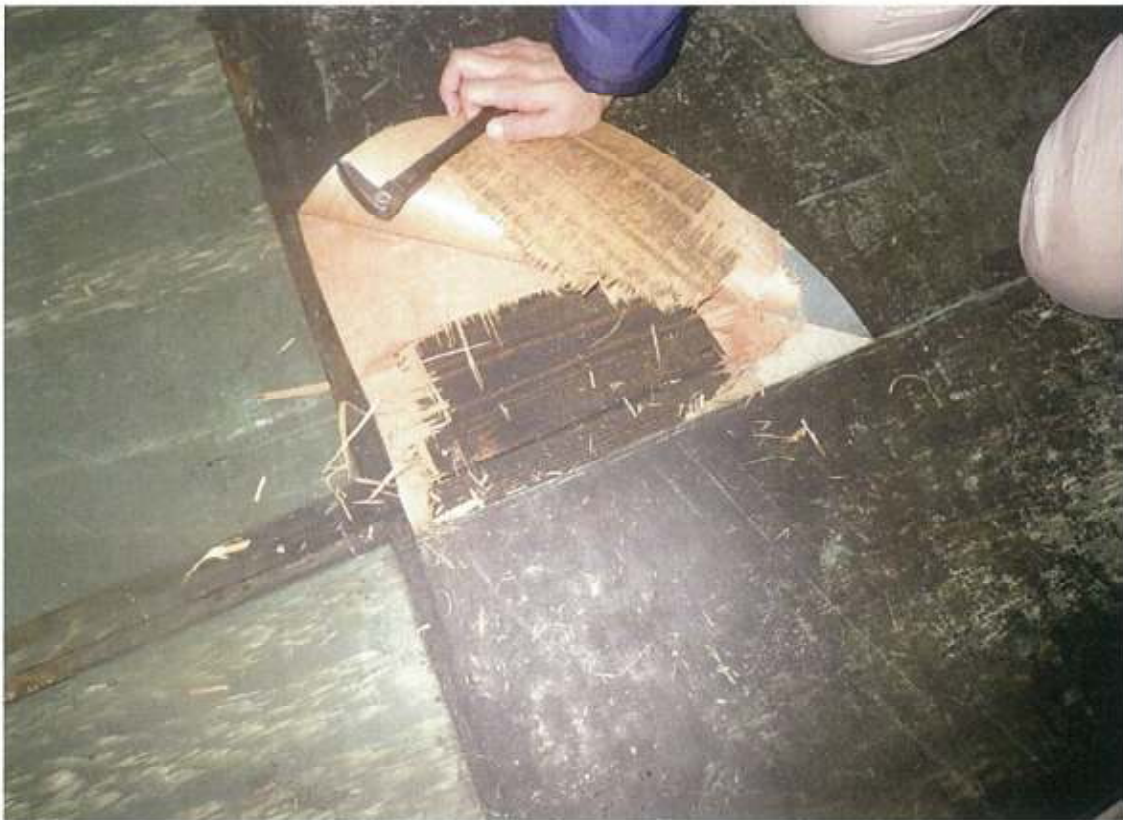
西本館 3階 議員会議室 床カーペット+長尺シート+ベニア+フローリング 床下柵殻