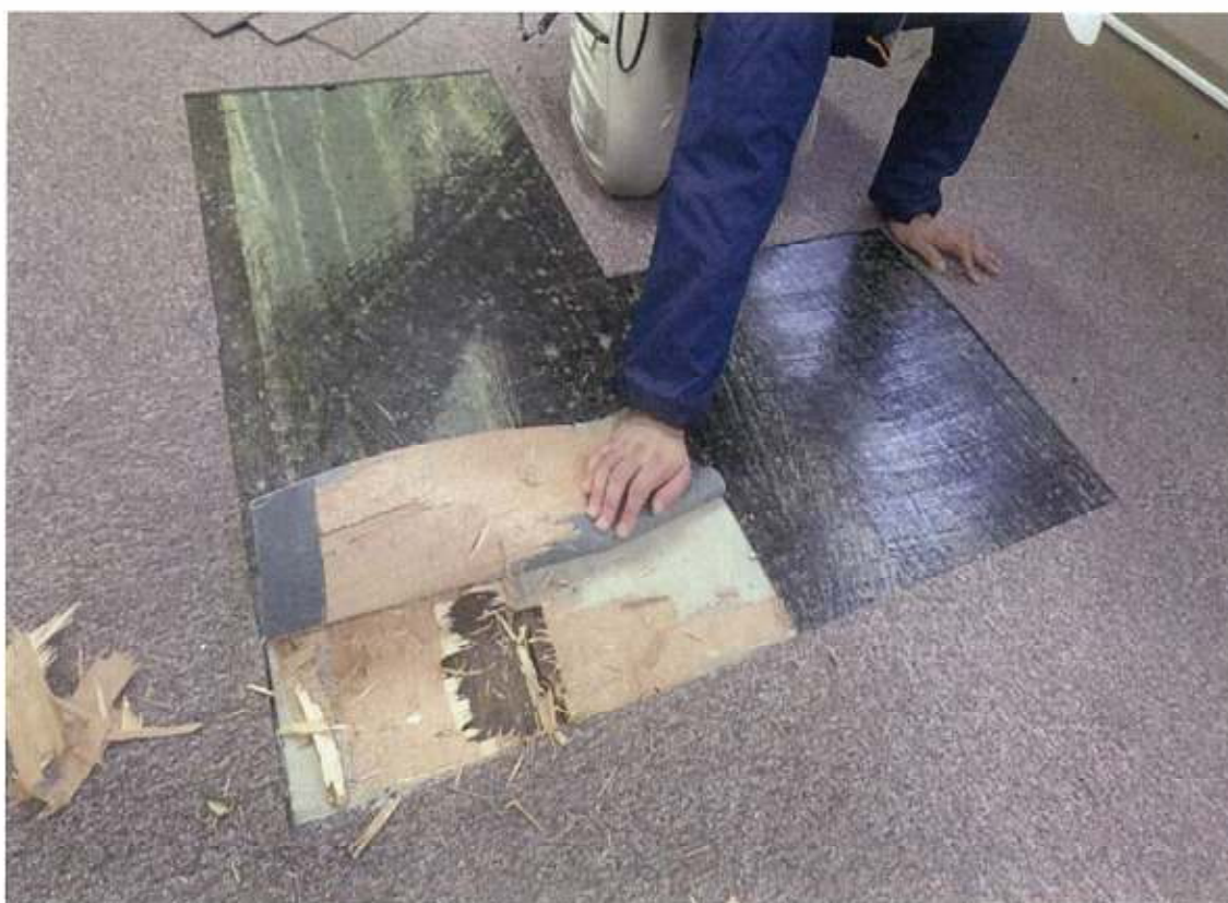
本館2階 副市長室 床カーペット+長尺シート+ベニア+フローリング 床下靱殻 (先行解体部分)