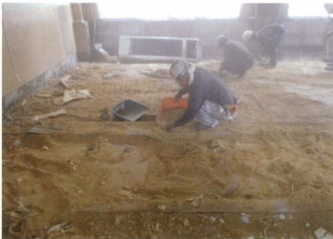
本館2階 市長室 床下撤去後粗穀確認 (先行解体部分)