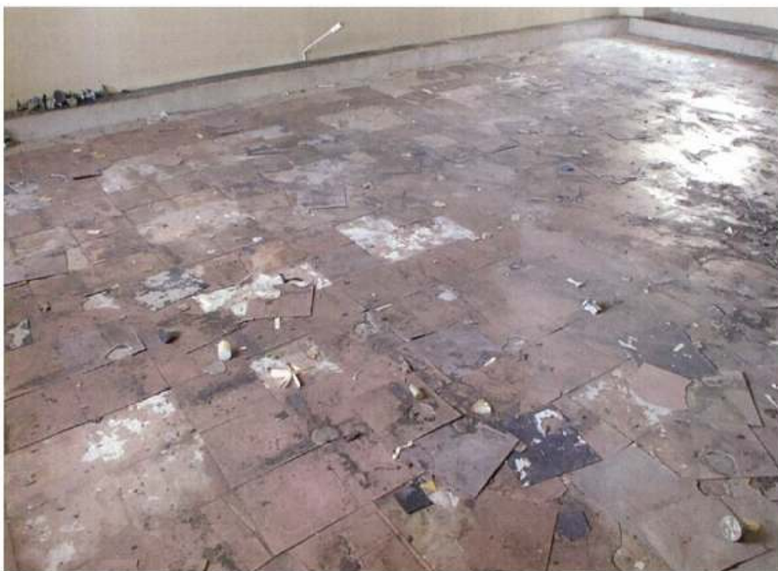
書庫棟2階 印刷室 Pタイル1層目撤去後