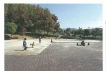
C 徳修公園 広い公園内には遊具や孔子をまつた聖廟が残る県指定有形文化財の徳修館があります。秋には徳修館まつりで開催されます。