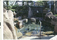
E バーデンハウス三丘 11種類の浴槽を備えた100%天然温泉。おいしい食事、全天然芝5コース40ホールの広大なグラウンド・ゴルフ場もあります。