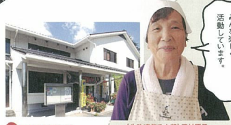
B 三丘修修館 (生炊道熊毛支部) 西村照子 三丘地区の拠点となる公民館。ホールや和室、グラウンド、テニスコートなどを備えています。幅広い年齢層が集う公民館です。