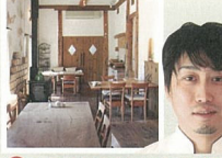
G 創作イタリアン&カフェ BOSCO 吹き抜けと露ストープが気持ちいい。女性を中心に人気のイタリアンレストランです。敷地内にはハンドメイドの雑貨屋もあります。