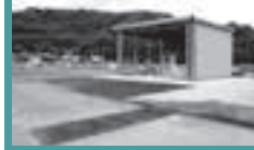
① 桑原漁港集荷施設整備