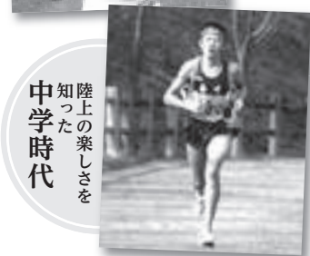
陸上の楽しさを知った 中学時代