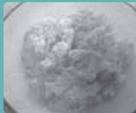
貧血に効く！ 切り干し大根の卵とじ