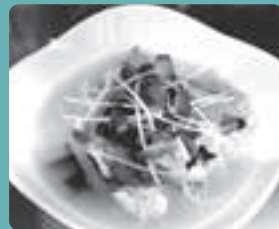
貝だくさん カンタンスープ