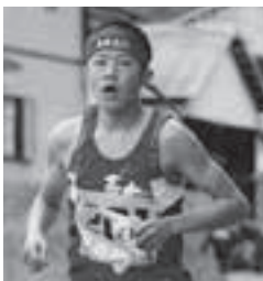
▲打倒・西京高校に燃えた高水高校での3年間。全国的にはまだ無名の存在だった

入部後は、「ついて行くのが必死だった」という日々を経て、ニューイヤーマラソンをはじめとする多くの大会を経験。ニューイヤーマラソンでは1区を走り、チームの日本一に貢献するなど自信を深めていった。