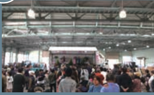
鼓海1丁目の市地方卸売市場で朝市が開催され、約4,000人の来場者が、即売会や餅まきなどのイベントを楽しみました。