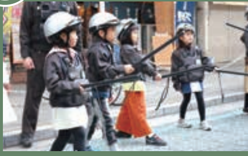
カフェや洋服屋、ケーキ屋など、子どもたちがさまざまな仕事を体験。徳山駅前の商店街はたくさんの親子連れで賑わっていました。