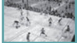
② バドミントン器具購入