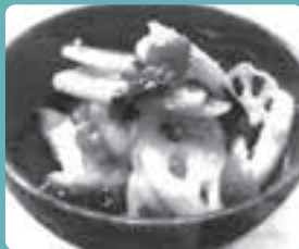
れんこんと明太子の バター炒め