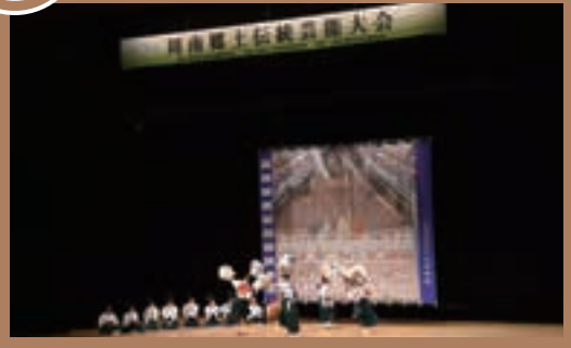
市内各地で古くから受け継がれている郷土伝統芸能の大会が開催され、この日は6団体が特色のある芸能を披露しました。