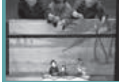
③ 文化振興団体への助成