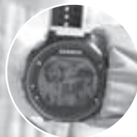
時計の背景は2人の愛娘。レース中のパワーの源だ