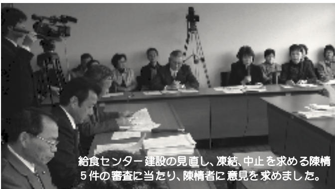
給食センター建設の見直し、凍結、中止を求める陳情5件の審査に当たり、陳情者に意見を求めました。