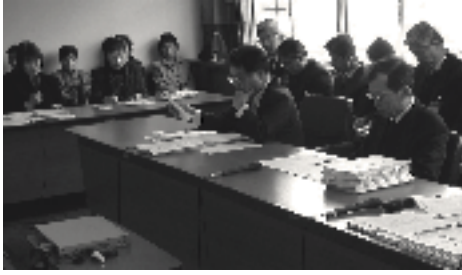
環境教育委員会では学校給食センター関連予算の修正案が提出され慎重に審査しました。

2月28日、3月1日、3月12日から15日まで及び22日に各常任委員会に付託された議案64件や請願・陳情8件の審査を行いました。 主な審査状況は次のとおりです。