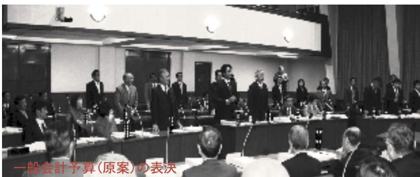
一般会計予算(原案)の表決

の討論では、15人の議員がそれぞれ賛成・反対の意見を表明しました。表決の結果、修正案は賛成少数で否決され、原案は賛成多数で可決されました。今定例会で審議した議案等の結果は7ページに掲載しています。表決に続いて、第7回目となる徳山駅周辺整備対策特別委員会の中間報告が行われました。