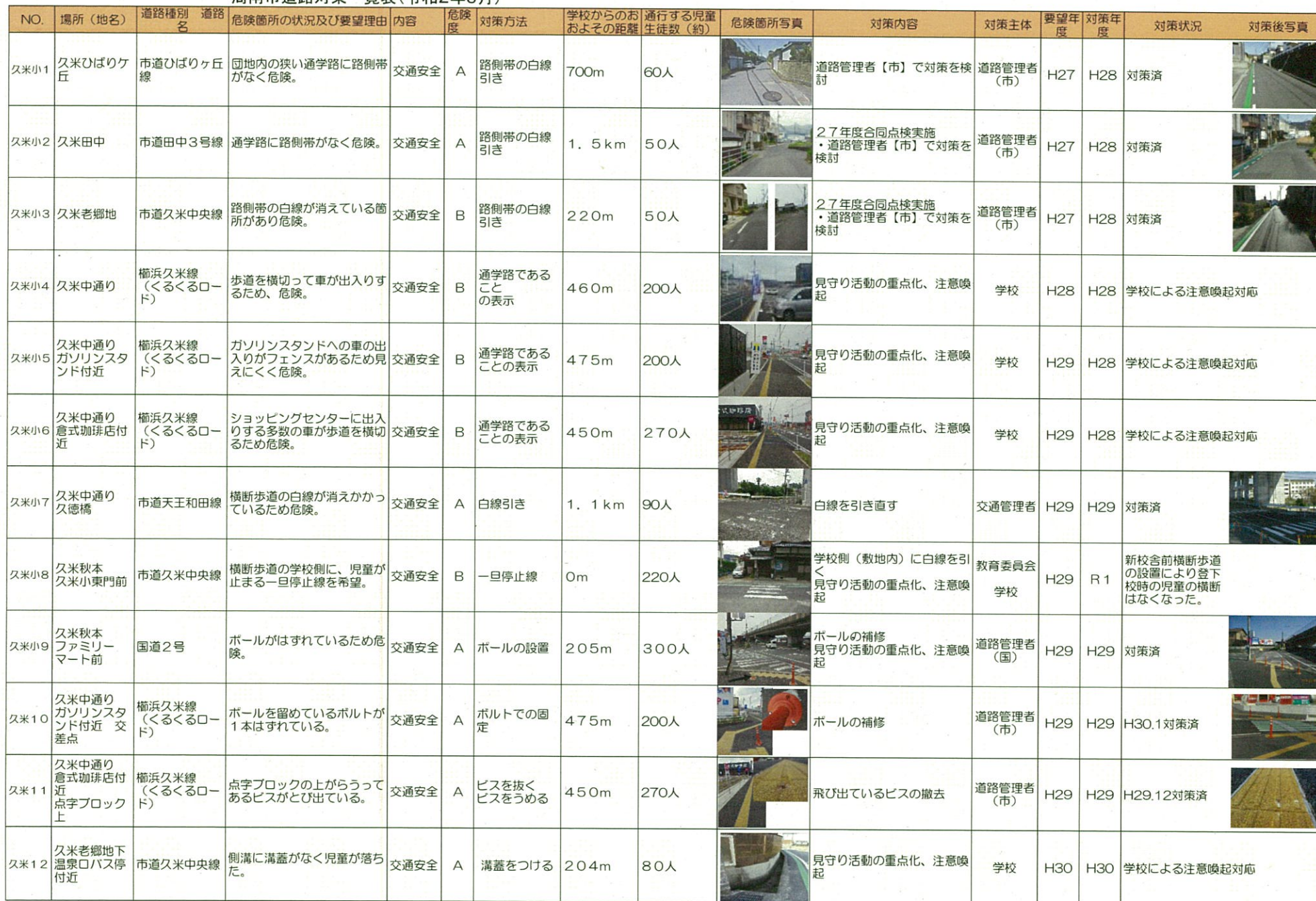
周南市道路対策一覧表(令和2年3月)