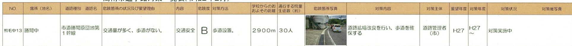
周南市通学路対策一覧表(令和2年2月)