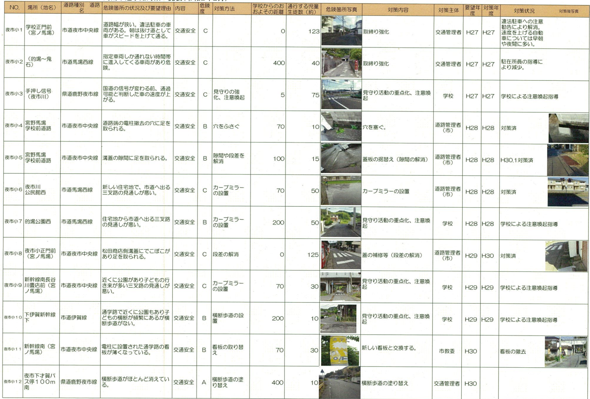
周南市通学路対策一覧表(令和2年2月)