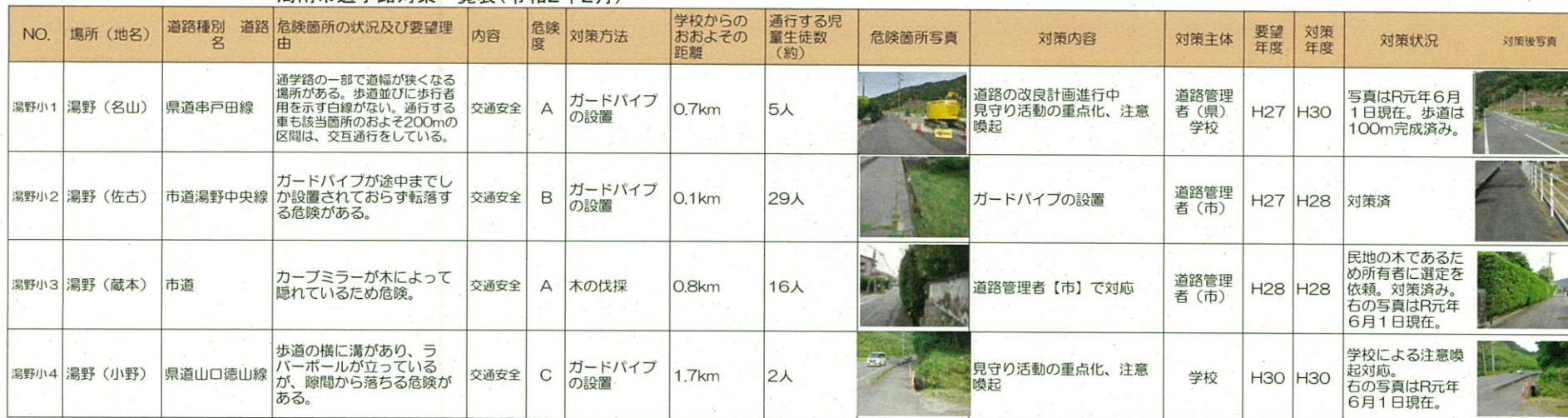
周南市通学路対策一覧表(令和2年2月)