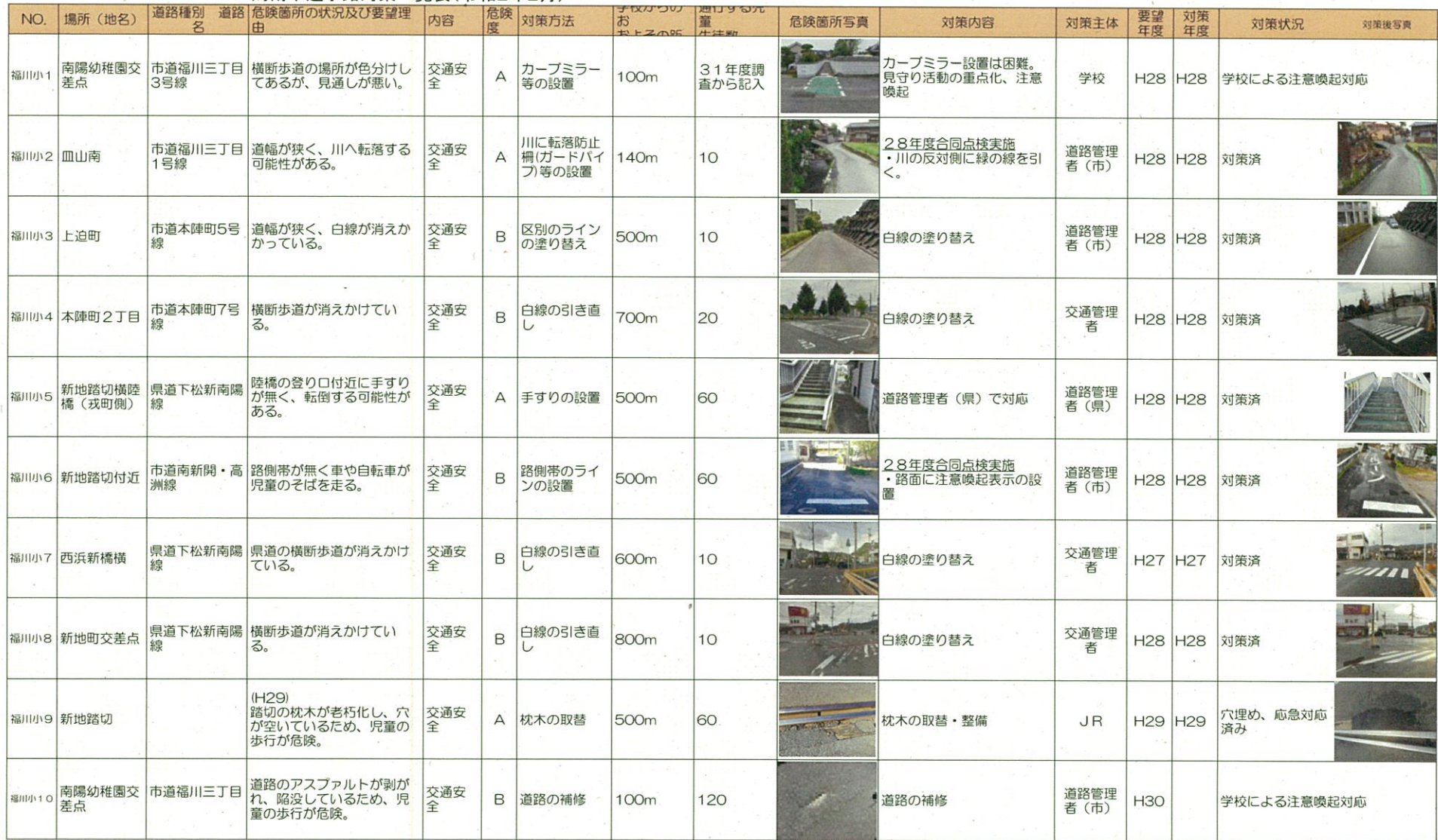
周南市通学路対策一覧表(令和2年2月)