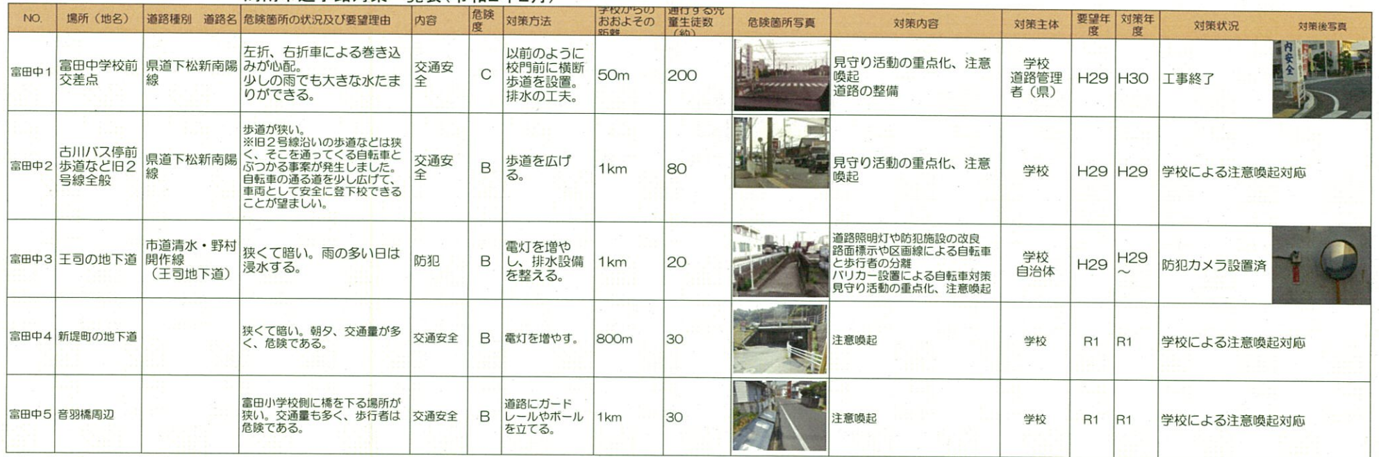
周南市通学路対策一覧表(令和2年2月)