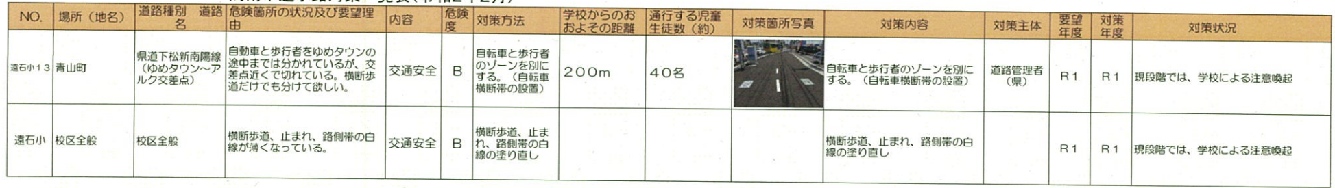
周南市通学路対策一覧表(令和2年2月)