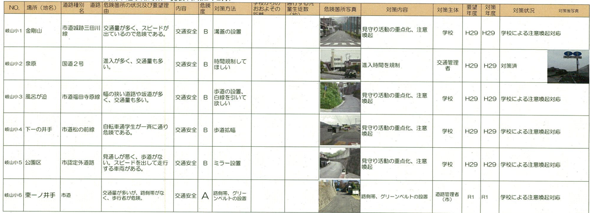
周南市通学路対策一覧表(令和2年2月)