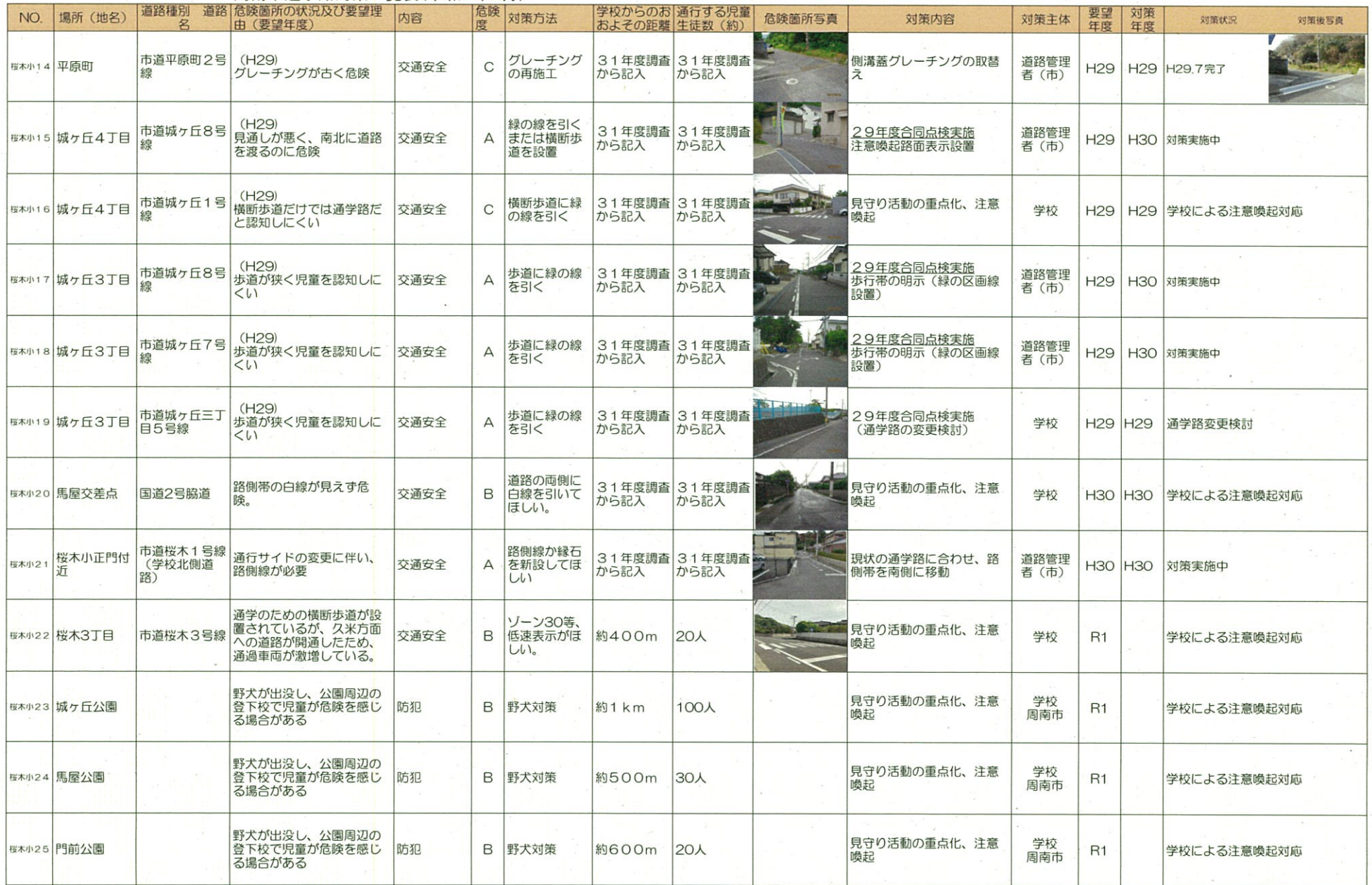
周南市通学路対策一覧表(令和2年2月)