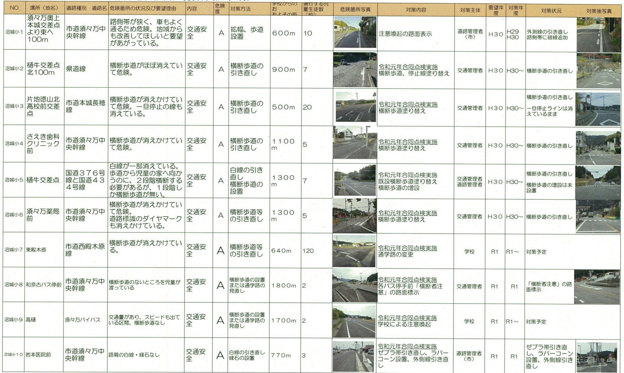
周南市通学路対策一覧表(令和2年2月)