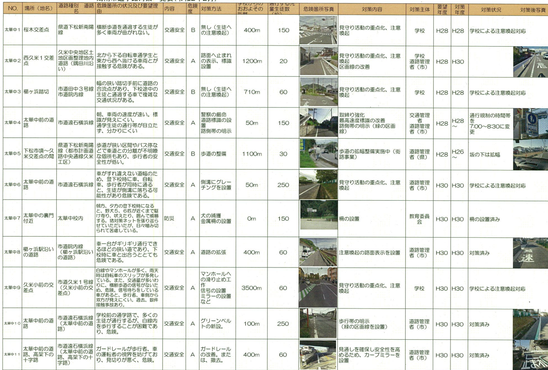
周南市通学路対策一覧表(令和2年2月)