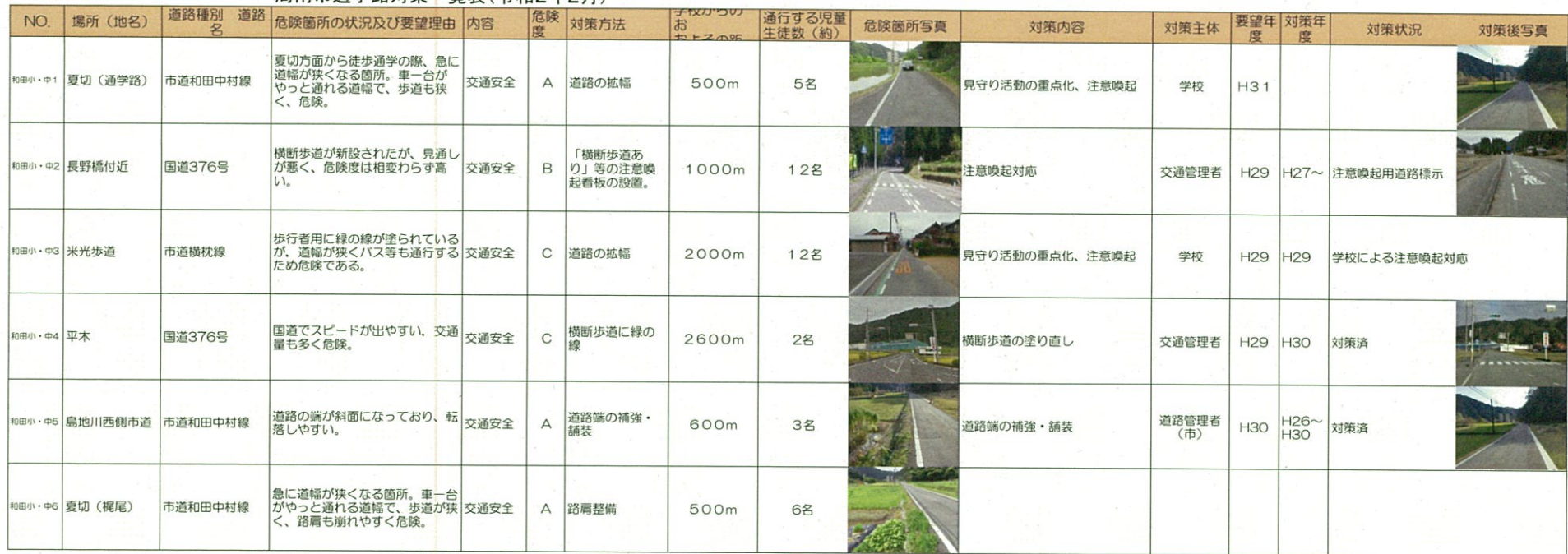
周南市通学路対策一覧表(令和2年2月)