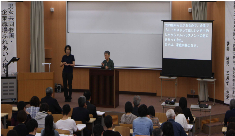
令和元年10月16日【徳山大学】