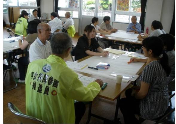
令和元年9月3日【夜市市民センター】