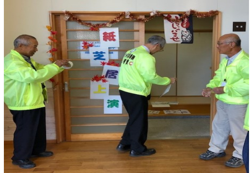
令和元年10月27日【ゆめプラザ熊毛】