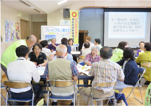
令和元年6月25日【勝間市民センター】

「男女共同参画」に関する3つのテーマについてグループごとにおしゃべり。初対面の人同志でも和気あいあいと、さまざまな意見交換をしました。