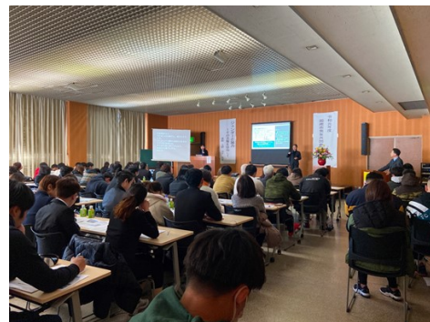
令和2年2月1日【徳山保健センター】