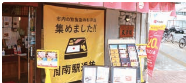
▲新しい生活様式に合わせた共同運営の店舗