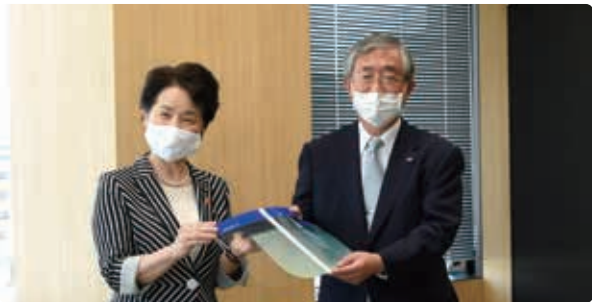
▲徳山医師会長へフェイスシールドを贈呈