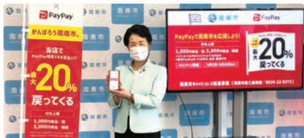
▲キャッシュレス決済のキャンペーンの紹介をする市長