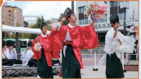
和田中学校の生徒と三作神楽保存会による三作神楽奉納演舞が開催され、荘厳な舞で観客を魅了しました。