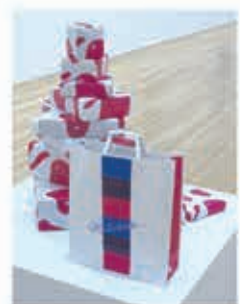
三越包装紙「華ひらく」1950年、 三越ジョッパー 1957年 猪熊弦一郎展 アートはバイタミ 展示風景 2020年