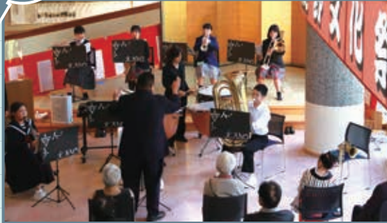
オープニングセレモニーとして、鹿野中学校吹奏楽部と卒業生をはじめとした皆さんが、演奏や舞踊を披露しました。