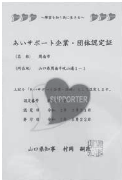
▲あいサポート企業・団体認定証