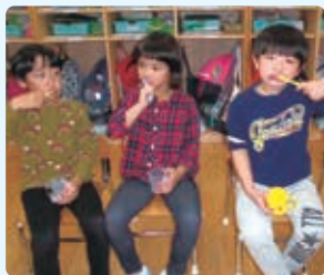
▲あい保育園ではのみがきチャレンジの様子

ウイルス感染は、喉の菌量と関係があり、さらに喉の菌量は口腔内の菌量と関係があります。よって、口の中がきれいになると、喉の菌量が減り、風邪などに感染しにくくなるといわれています。体調管理や手洗い、うがいなどに歯磨きをプラスして、口の中を清潔に保つようにしましょう。