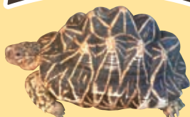
▲甲羅は大きい個体で30センチメートル程度。

美しい模様の甲羅が目を引きインドホシガメは、南アジアの草原など、一年中暖かい地域に生息しています。そのため、カメたちが過ごす爬虫館の室温は、今のような寒い季節でも28~30℃になるようにしています。展示場の中には数カ所に赤外線ランプをつけてより暖かい場所