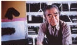
「猪熊弦一郎」 (林忠彦撮影「日本の画家」より) 周南市美術博物館蔵

※身体障害者手帳、療育手帳、精神障害者保健福祉手帳、戦傷病者手帳等をご持参の方とその介護の方は無料 ※本展をご鑑賞の際は、常設展も無料でご覧いただけます