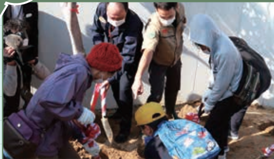
50周年記念式典の際に埋設したタイムカプセルを、当時手紙を埋めた人たちが、動物園職員と一緒に掘り起こしました。