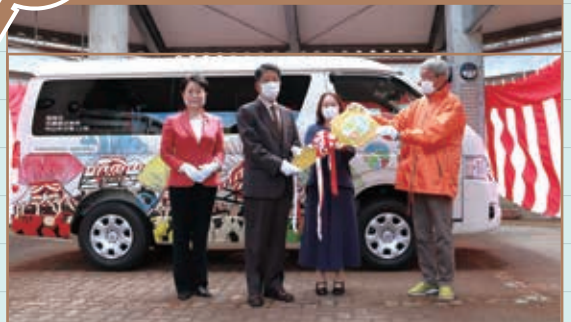
中須地区の伝統芸能の一つである夏祭りの揉山(もみやま)をラッピングした、コミュニティバスのお披露目がありました。