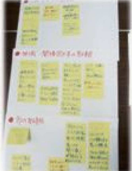
のびのび はつらつ いきいき周南21推進委員会の様子