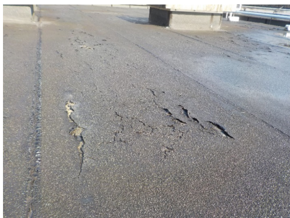
【富田中学校特別教室棟(防水)】