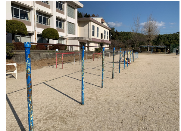
【大河内小学校(鉄棒)】