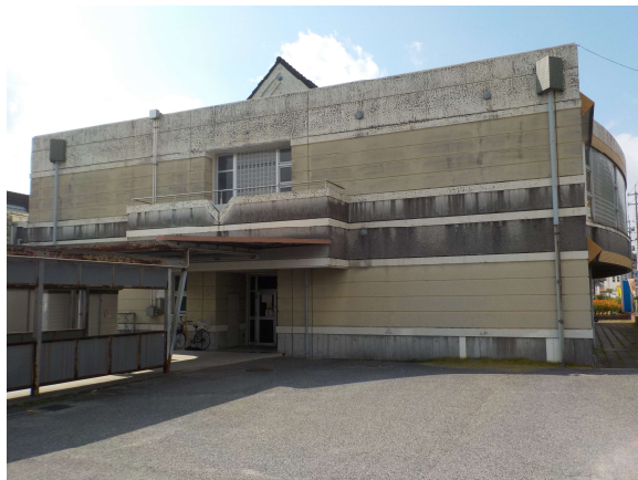
【富田西小学校教室棟(外壁・防水)】