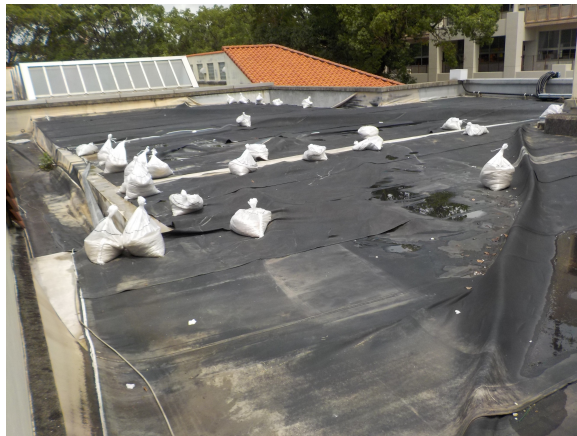
【徳山小学校管理特別教室棟(防水シート)】