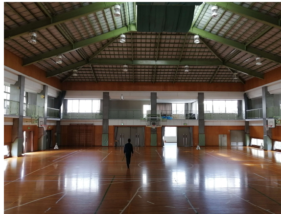
【富田東小学校屋体(LED照明)】