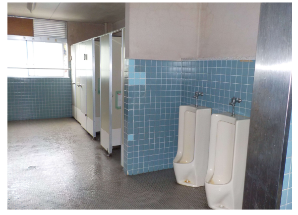
【沼城小学校管理教室棟(トイレ)】