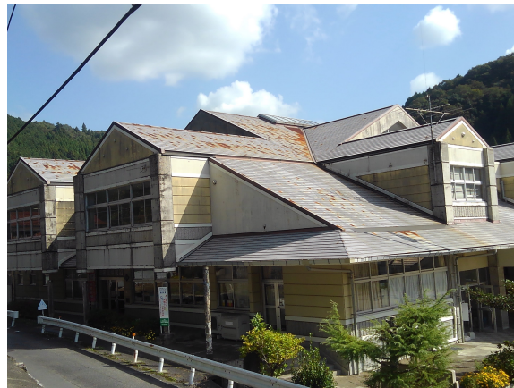
【和田小学校管理特別教室棟(屋根・外壁)】