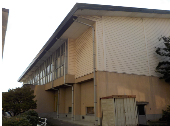
【秋月中学校屋体(外壁・防水)】