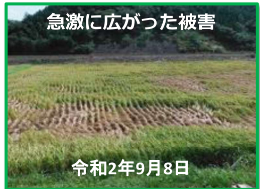
急激に広がった被害