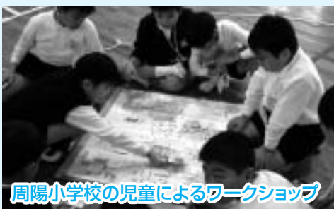
周陽小学校の児童によるワークショップ