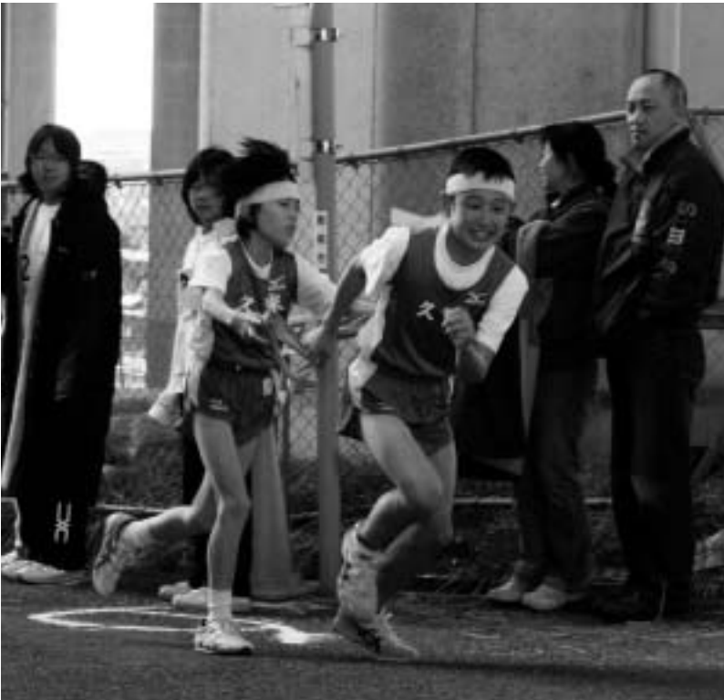
中継地点では、後方のチームの姿を気にしながら、日ごろの練習の成果を信じて、たすきをつなぎます