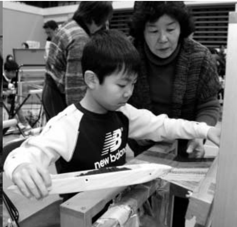
さおり織りの体験コーナー。優しい先生の手ほどきに従って色とりどりの糸を織ると、きれいな織物ができあがりました