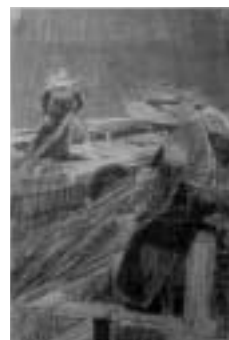
瀬戸内の漁夫（網船） 水彩画 幅37.7cm×高さ57.5cm