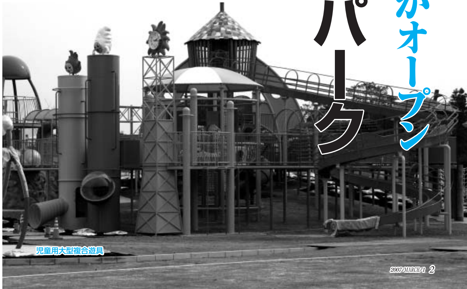
児童用大型複合遊具

子どもたちが遊びながら、体力や危機回避能力、創造力の向上ができる遊具がそろっています。