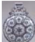
白地藍彩吉祥紋磁器 オランダ 18世紀 テルフト

出光美術館が所蔵する国内外屈指のコレクションから、17世紀から18世紀にかけての染付、古伊万里、色絵などを展示し、陶磁器の東西文化の交流と歴史をたどります。