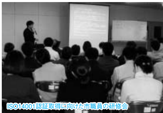
ISO14001認証取得に向けた市職員の研修会