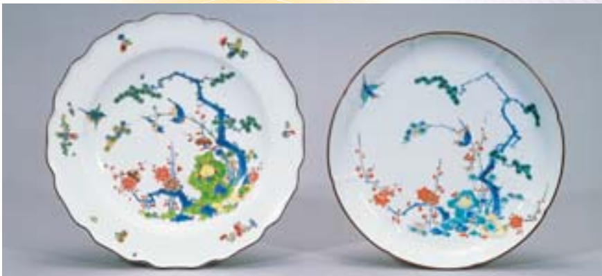
(右)色絵松竹梅鳥文皿 日本 柿右衛門 江戸時代前期 (左)色絵松竹梅鳥文皿 ドイツ マイセン 18世紀

濁手とよばれる乳白色の地に赤や黄、青、緑などの色で日本的な絵柄を描いた様式を柿右衛門といいます。有田の陶工、酒井田柿右衛門によって確立されたとされる様式で、そのエキゾチックな意匠はヨーロッパで大変好まれました。