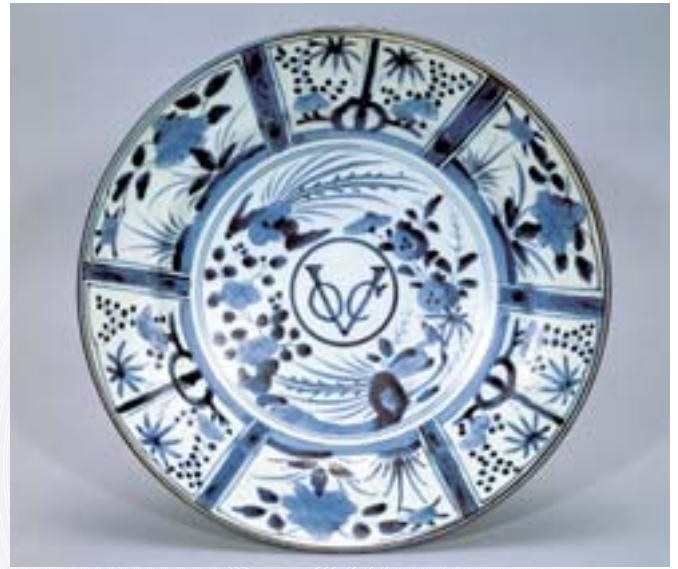
梁付芙蓉手鳳凰文皿 日本 肥前 江戸時代中期

※18歳以下および70歳以上、身障者の方は無料です。 受付で証明できるものをご提示ください。 ※本展をご鑑賞の際は、常設展も無料でご覧いただけます。