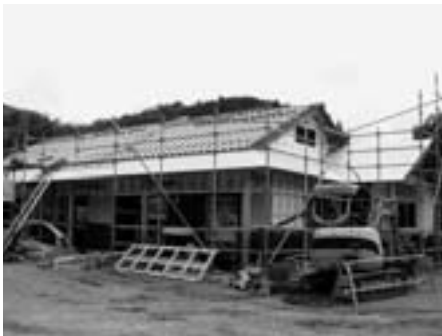
ブドウやナシの収穫時期を迎える8月の完成をめざして、建設中のふれあいプラザ須金

今後の活動について「プラザの運営を核に交通手段の確保など、生活の基盤整備に努め、安心して住める須金をつくりたい」と過疎地域の先進事例になる意気込みを語ります。