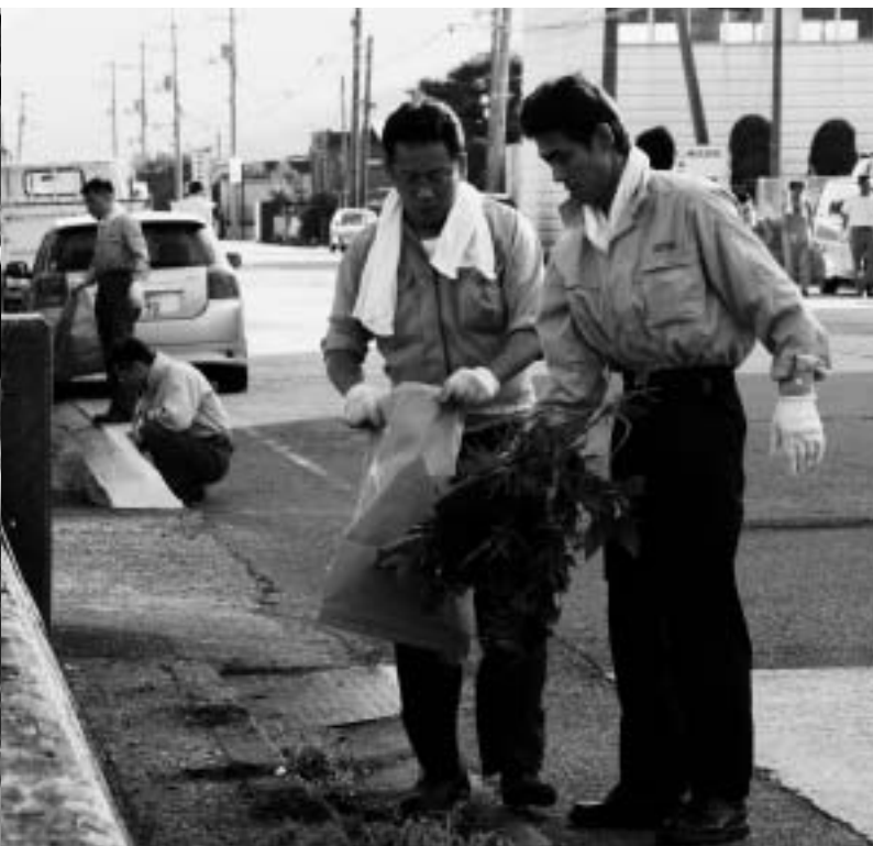
参加した皆さんは汗をかきながら、ごみを拾ったり、側溝の草や土を取り除いたりして、徳山港周辺をきれいにしました