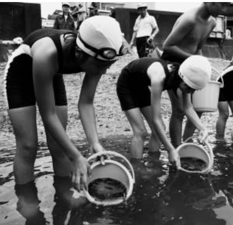
広い海に放たれて元気に泳ぐ稚魚に向かって、子どもたちは「大きくなって戻っておいで」と声を掛けていました