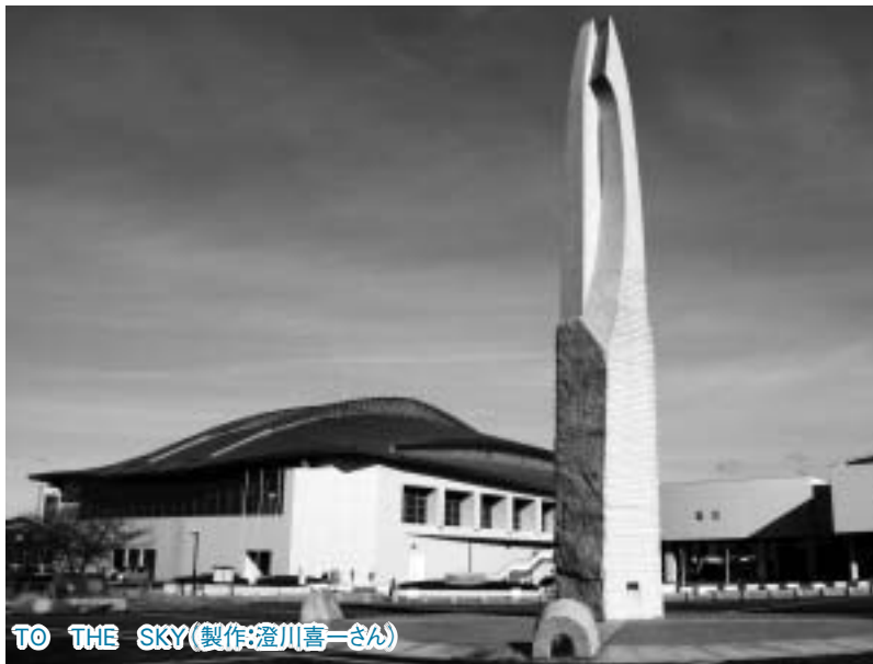
TO THE SKY(製作:澄川喜一さん)