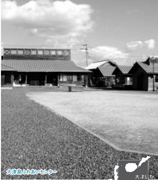
大津島ふれあいセンター