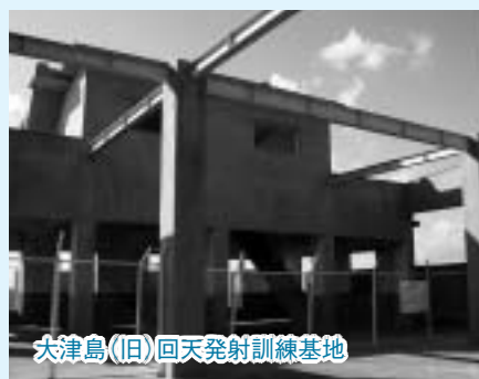
大津島(旧)回天発射訓練基地

今回の土木遺産の認定は、第二次世界大戦末期に造られた回天の発射訓練基地跡4か所のうち、唯一残された場所で、良好な保存状態が戦争遺産として貴重であること。島の一部が瀬戸内海国立公園に指定され、眺望、景観とも優れていると評価されたものです。