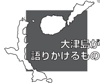
大津島が語りかけるもの

全国有数の御影石が採掘される黒髪島や自然素材が豊かな大津島が、多くの芸術家から支持されています。大津島を拠点に活動する芸術家の作品が発するメッセージは、新しい大津島のイメージを創出します。