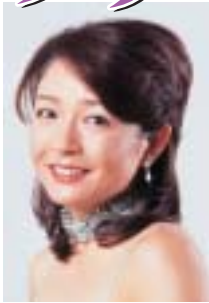
ピアノ・仲道郁代～

卓越したテクニック、たおやかな詩情。日本はもとより、海外からの評価も高いピアニスト。世界の一流指揮者や演奏家と次々に共演している実力派。桐朋学園大1年の時日本音楽コンクール第1位および増沢賞受賞で注目を集める。数々の国内外での受賞を経て、国際的に活躍中。