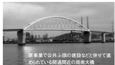
県事業で公共ふ頭の建設などと併せて進められている開通間近の周南大橋

問合せ／企画調整課海面埋立事業推進室 ☎0834-22-8204 ※1は、2003年実績 ※2は、2002年実績