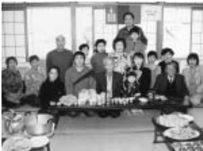
毎年2月に行う「モンゴルの旧正月を祝う会」。留学生と一緒に作ったモンゴル料理を食べながら、旧正月を祝います。

「私たちの活動をきっかけにして、モンゴルにも『モンゴル山口友好センター』が発足しました。これからは、センターと協力しながら、向こうに身障者が自立するための更生施設を作りたいと思っています。モンゴルは遠い国と思われがちですが、『近くて親しみのある国』として、交流の輪を広げていきたいですね」。