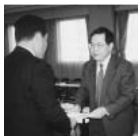
昨年の12月1日に「周南市一般廃棄物処理基本計画」が市長に答申されました。

経験者、事業者、関係行政機関職員の皆さんが、部会や全体会議で熱心な議論を重ね、平成17年から10年間に本市が達成すべき目標と、その実現のために進めるべき施策を「周南市一般廃棄物処理基本計画」に取りまとめました。