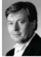
指揮：首席指揮者 ペトル・アルトリフテル

「ヨーロッパ屈指の音楽都市」チェコの首都ブラハに誇る名門オーケストラ。チェコ・フィル、プラハ放送響と並ぶ三大オーケストラの一つ。