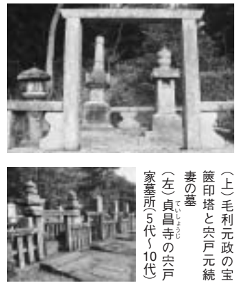
(上)毛利元政の宝篋印塔と穴戸(元統)の妻の墓 (左)貞昌寺の穴戸家墓所(5代〜10代)