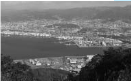
太華山の山頂から望む中心市街地。下が櫛浜地区にある卸商業団地や東部浄化センター

櫛浜地区は、温暖な気候に加え、徳山湾と笠戸湾の豊かな漁場と肥よくな土地に恵まれ、古くから漁業、農業を主な地場産業として発達してきました。特に漁業の歴史は古く、元禄年間(1688年～1703年)には、魚市場が開設していたといわれています。