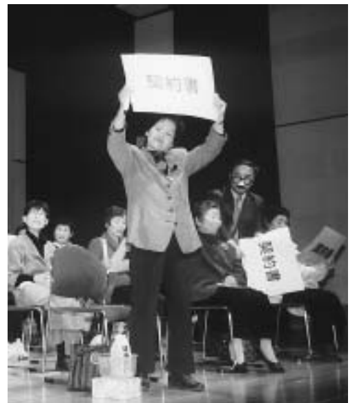
大会では悪質商法の被害を防ぐ寸劇も行われます