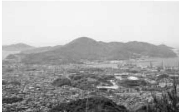
「とおの山」から望む太華山の全景

や下松市の島々、また展望台に登ると遠く四国、九州まで眺望でき、瀬戸内海の美しい風景が楽しめます。