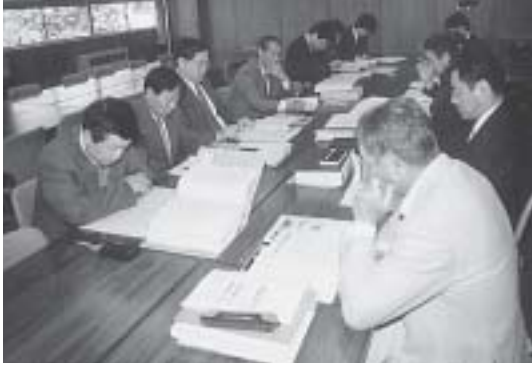
ごみ対策推進審議会のそれぞれの部会で、熱心に議論が重ねられました