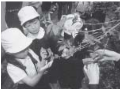
学校の裏庭にギフチョウを放す八代小学校の生徒たち

「ギフチョウを育てるには適度な暑さと寒さが必要で、八代はそれに適しています。また、幼虫の餌のカンアオイの葉をギフチョウのいない日本海の地方まで取りに行くことによって毎年たくさんう化させることが出来ました。これが14年も育てられた秘けつです。しかし、せつかく放しても愛好家によって捕まえられてしまうこともあります。また、カンアオイは山の手入れがしてあるところにしか生えません。人間と自然がうまく共生して、ギフチョウを守っていききたいですね」。