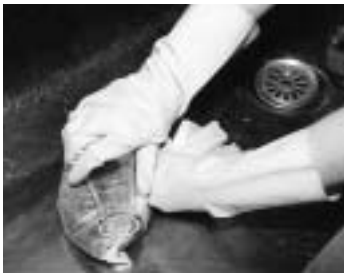
生ごみの水切り。 一人ひとりの協力が、大きなごみの減量化につながります

リサイクルセンターを見学する小学生。環境に対する学習を行うことで、ごみに対する意識も変わります