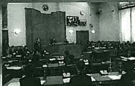
市内小学生によるこども議会