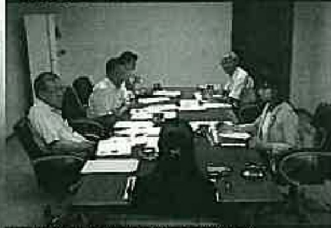
東京都足立区(子供の貧困対策)視察