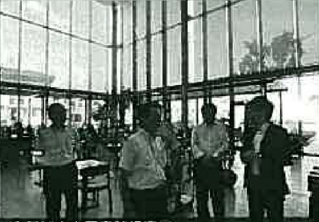
多賀城市立図書館視察②