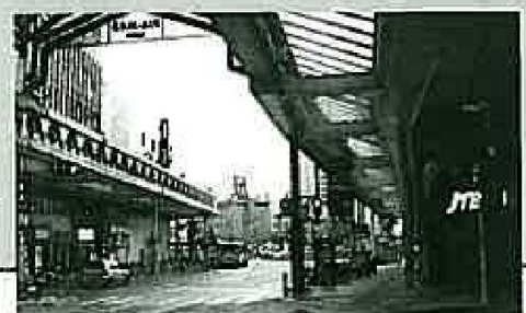
▲徳山銀座通り商店街