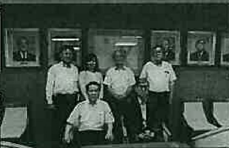
自民党本部にて 高村正彦副総裁と市政状況を報告し懇談