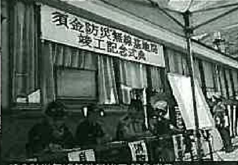
須金防災無線基地局竣工記念式典