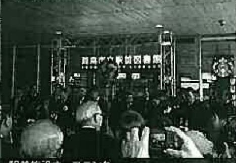
県前施設オープニング