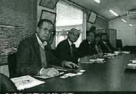
名護市(許田道の駅)視察