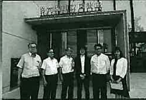
多賀城市立図書館視察①