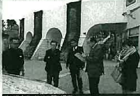
沖縄市(こどもの国)視察