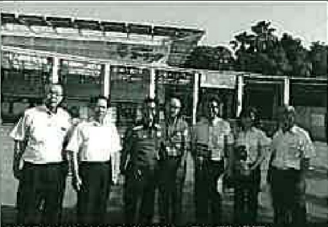
横浜市(よこはま動物園スーラシア)視察