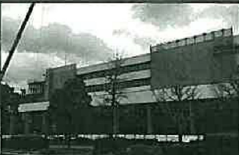
完成間近の新庁舎