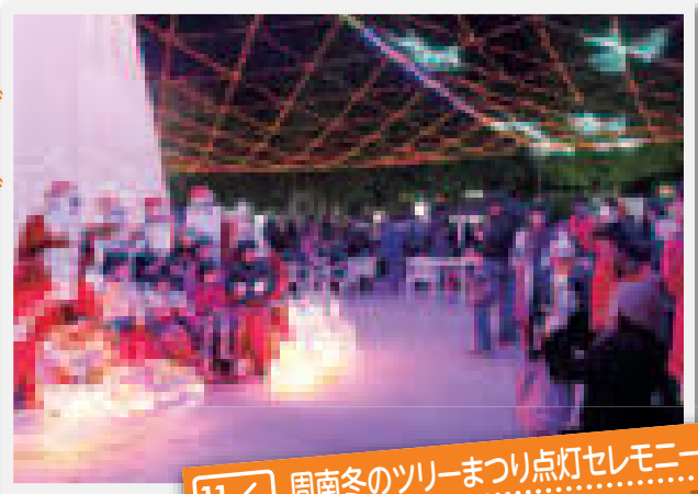
11/28 周南冬のツリーまつり点灯セレモニー 場所:青空公園

周南冬のツリーまつりの点灯セレモニーが、青空公園で行われました。今回は、11月13日にみなと会場で、約10万球のイルミネーションがひと足先に点灯。御幸通りなどと合わせて、約60万球の光が街を満たしました。訪れた皆さんは、幻想的な光に満たされた会場で、写真を撮影したり、思い思いにイベントを満喫しました。