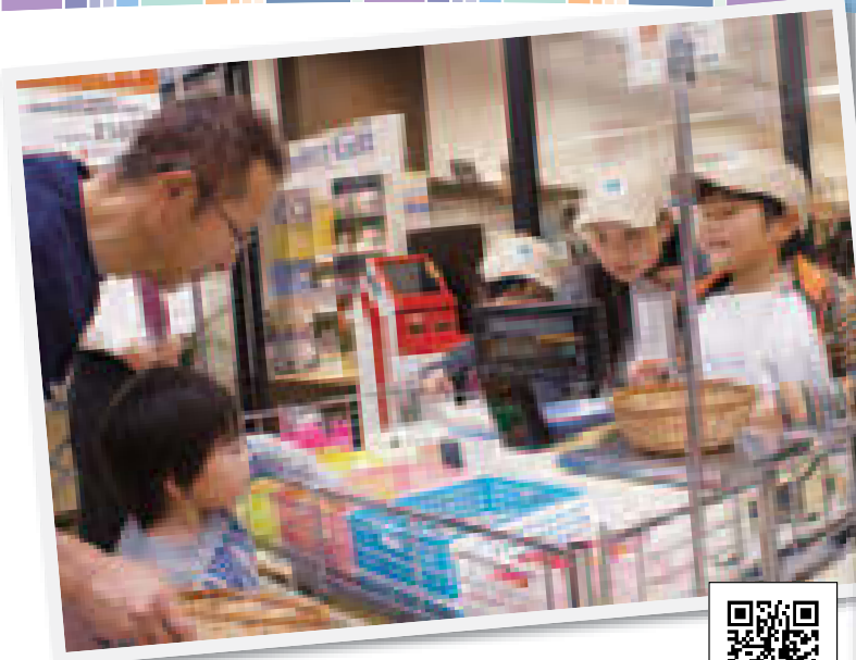
11/23 こどもっちゃ!商店街 場所:徳山商店街ほか