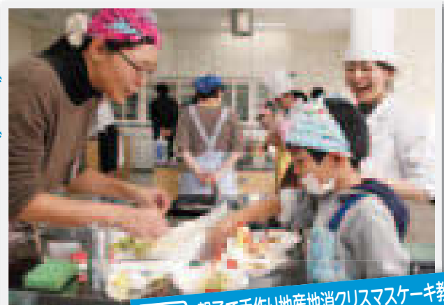
12/5 親子で手作り地産地消クリスマスケーキ教室 場所:学び・交流プラザ

小学生の親子7組15人が参加した、ケーキ作り教室が行われました。本市で生産される食材について学び、市内産の果物や牛乳などを使って調理。宇部フロンティア大学短期大学の学生を講師に迎えて、丁寧な指導を受けながら、親子で協力し合ってケーキを作りました。皆さんは色鮮やかに飾り付け、終始夢中で楽しみました。