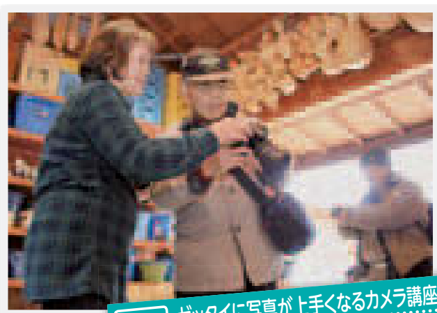
11/29 ゼットタイに写真が上手なるカメラ講座 場所:大道理夢求の里交流館