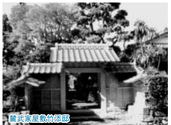
麓武家屋敷竹添邸

また、都市の宣伝を通じた観光客の誘致、物産展などの場を利用した特産品の紹介や販売を積極的に行い、文化やスポーツなどさまざまな分野での市民同士の交流など、両市の特性を生かした継続可能な交流事業を関係者と協議しながら進めていきます。