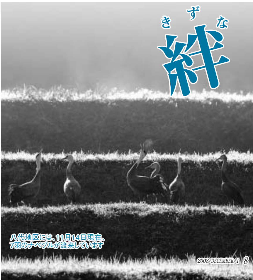
八代地区には、11月14日現在、7羽のナベヅルが渡来しています