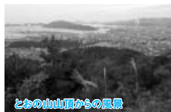
とおの山山頂からの風景

皆さんも、ぜひ、一度登頂して、すばらしい眺望を味わってください。また、毎年、元旦には新春登山の行事も行っています。