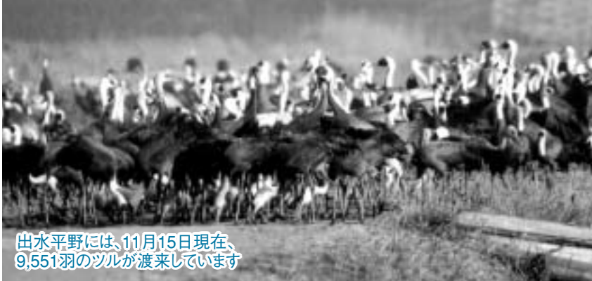
出水平野には、11月15日現在、9,551羽のツルが渡来しています