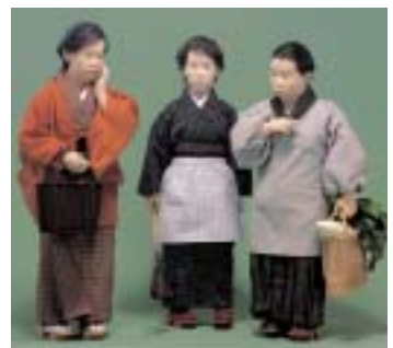
お早よう—ご近所 2005年