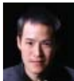
ヨーヨー・マも絶賛! 深き癒しのヴァイオリン、渾身の音楽 ヴァイオリン:ジョセフ・リン