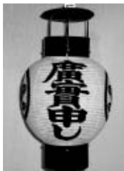
当番に当たった家が客人を案内する提灯

町の向畑地区に落ちのび、その子孫が須金地区の一部を開拓し、繁栄しました。祭りは、両地区の一族が先祖を祭り、結集を図るために始まり、6年に一度、両地区が交代で行います。