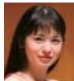
美しき20歳の 天才ピアニスト ピアノ:アリス=紗良・オット