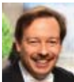
シベリウスの スペシャリスト 指揮:ベトリ・サカリ

ビョークを生んだ北歐の音楽の都・アイスランドより初来日 世界水準のオーケストラがついに天才ソリスト二人と周南へ!