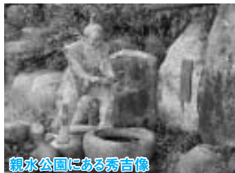
親水公園にある秀吉像

現在では、手洗川と名を変え、親水公園には、当時の秀吉が手を洗う姿を再現した像が作られています。