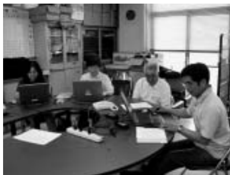
現在、パソコンでの点訳が通常になり、会員の皆さんは、好きな本を片手に点訳作業を進めます

点訳やまびこの会は、昭和45年に発足したボランティアグループで、市内をはじめ下松・光・岩国市など、幅広い地域に住む87人の会員で活動しています。会では、主に視覚障害者の人たちのために文学小説や広報しゅう