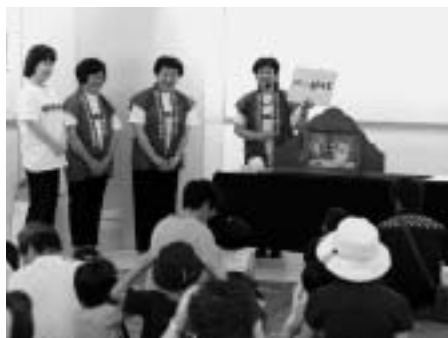
徳山動物園で行われる紙芝居は、9月までの毎週土・日曜日の10時から11時まで上映しています

本市の山口どこでも紙芝居は、徳山動物園で、9月までの毎週土・日曜日に行われています。内容は、ナベツルやキツネなど地域にゆかりのある動