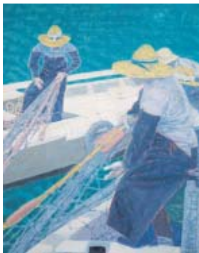
網船(瀬戸内漁夫)1971年(昭和46)油彩・キャンバス

観覧料/一般900円(800円) 大学生700円(600円) ( )内は前売及び団体(20名以上) 18歳以下および70歳以上、身障者の方は無料 受付で証明できるものをご提示ください