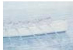
カッター(我は海の子) 1972年(昭和47) 油彩・キャンバス

周南市出身の洋画家、尾崎正章(1912~2001年)は、生涯にわたってふるさとの風景を描き続けました。中でも白色を主体とした風景画は「白い叙情」と呼ばれ、静謐な画面の中にも作者の絵に対する情熱と、ふるさとへの愛を垣間見ることが出来ます。本展では「周南市郷土美術資料館・尾崎正章記念館」の所蔵品を中心に約80点を展示し、氏の画業をたどりま。