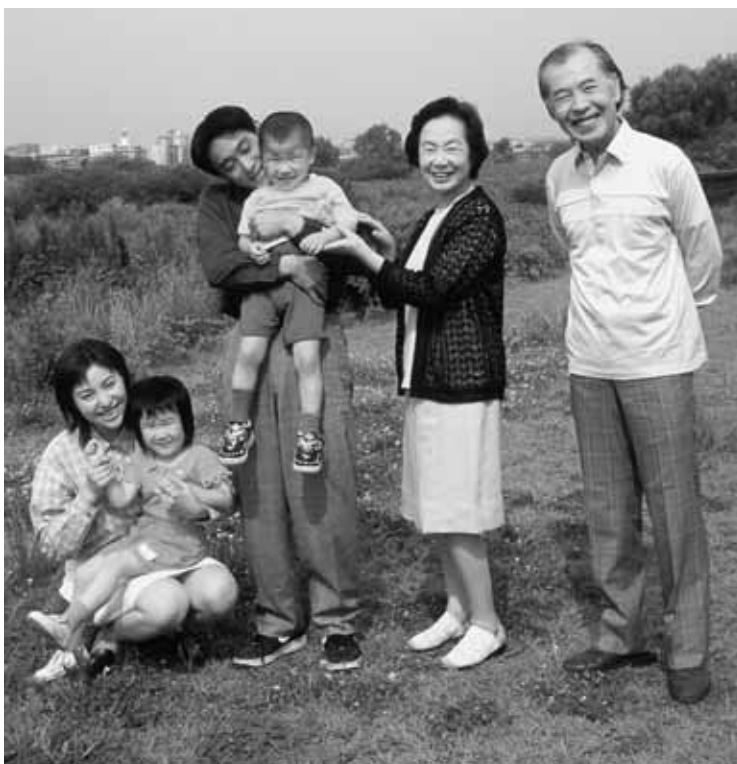
国民健康保険料の料率

3歳から小学校入学前まで(6歳の誕生日以後の最初の3月31日まで)の子どもの患者負担は、4月から2割に引き下げました。