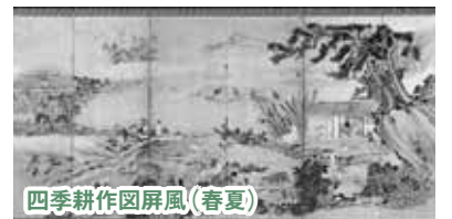
四季耕作図屏風（春夏）

南陵は、色鮮やかな花鳥画など、数々の作品を描いていますが、中でも美術博物館所蔵の「四季耕作図屏風」は逸品とされています。