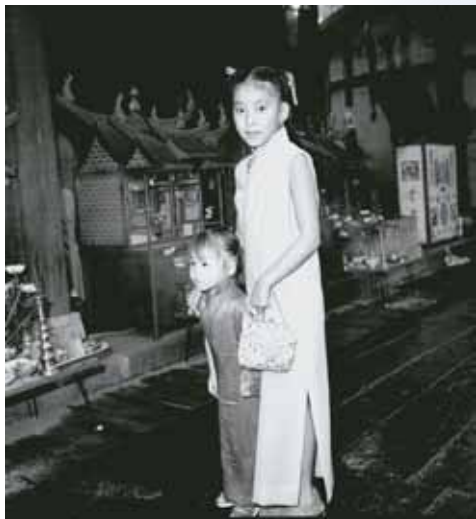
關盆勝会2 長崎市鍛冶屋町、崇福寺 1977年9月