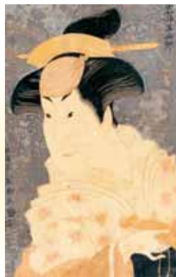
東洲斎写楽 「四代目岩井半四郎の乳母 重の井」

観覧料 一般 900円(800円) 高大生 700円(600円) 中学生以下無料 ※( )内は前売 および団体(20名以上)