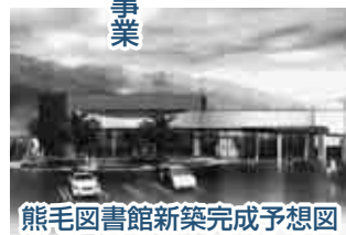
熊毛図書館新築完成予想図

市では、熊毛地域の生涯学習や保健・福祉、市民交流などの拠点施設になる(仮称)コアプラザ熊毛整備事業を進めています。